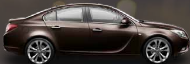
Dark Mahogany (Коричневый)