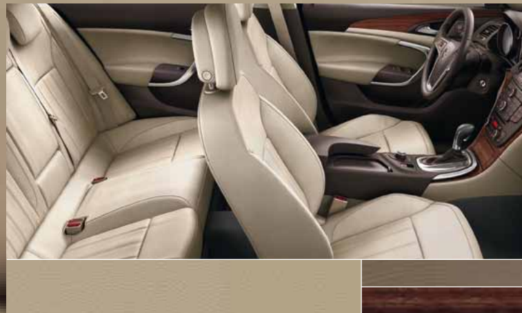
Кожа Siena, цвет – бежевый Декоративные молдинги: Rapid Warm, Kibo Wood