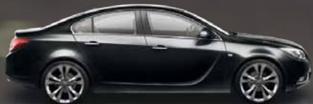
Carbon Flash (Черный)