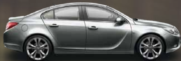
Silver Lake (Серебристый)