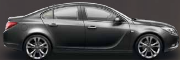
Technical Grey (Серый)