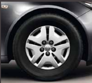
1 Стальные колесные диски с колпаками, 6.5 J x 16, 5-спиц, шины 215/60 R 16 (QB5).