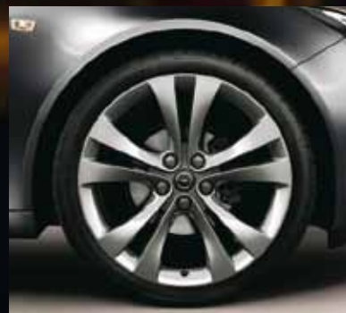
8 Легкосплавные колесные диски, 8.5 J x 20, 5-двойных спиц, шины 245/35 R 20 (Q9U). Колесные диски с зеркальной полировкой.