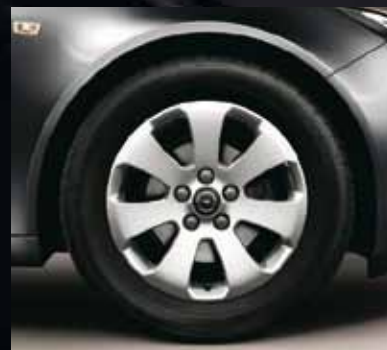
3 Легкосплавные колесные диски, 7 J x 17, 7-спиц, шины 225/55 R 17 (Q00).