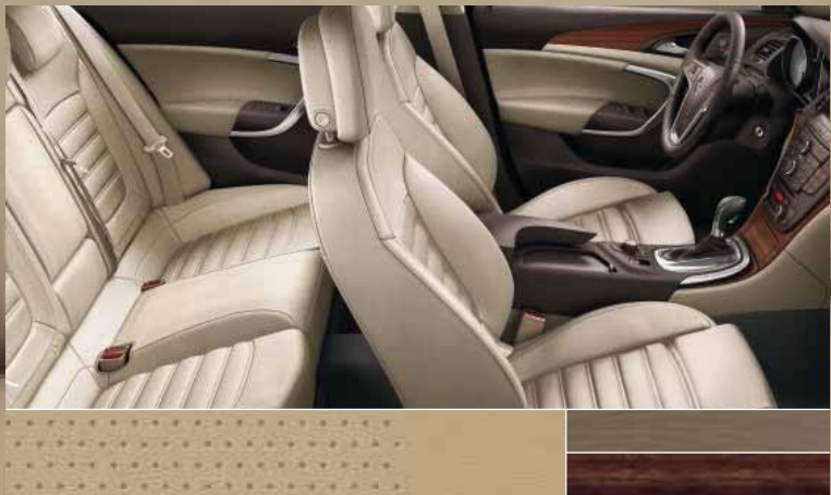
Перфорированная кожа Siena, цвет – бежевый Декоративные молдинги: Rapid Warm, Kibo Wood