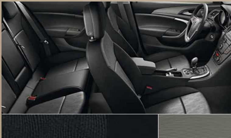
Отделка Dune/Atlantis, цвет – черный Декоративные молдинги: Rapid Cool