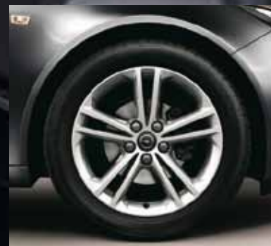
4 Легкосплавные колесные диски, 8 J x 18, 5-двойных спиц, шины 245/45 R 18 (Q02).