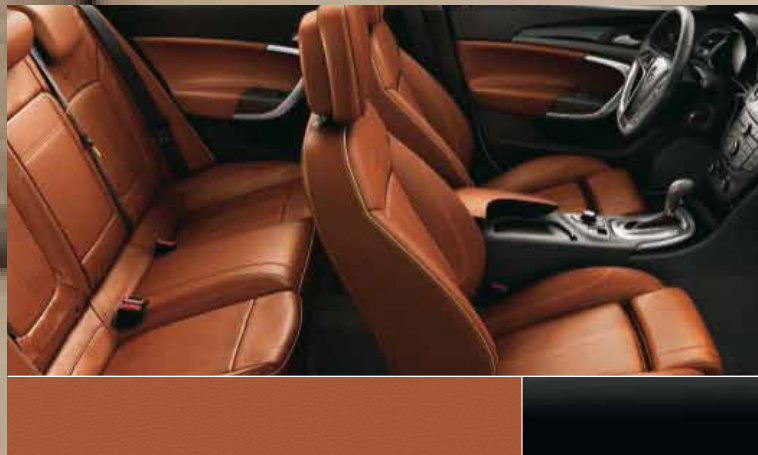
Кожа Siena, цвет – коричневый Декоративные молдинги: Piano Black