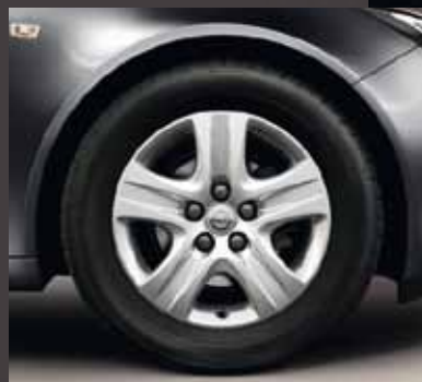
2 Структурные колесные диски, 7 J x 17, 5-спиц, шины 225/55 R 17 (QR8).