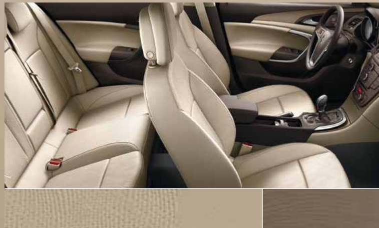
Отделка Dune/Atlantis, цвет – бежевый Декоративные молдинги: Rapid Warm