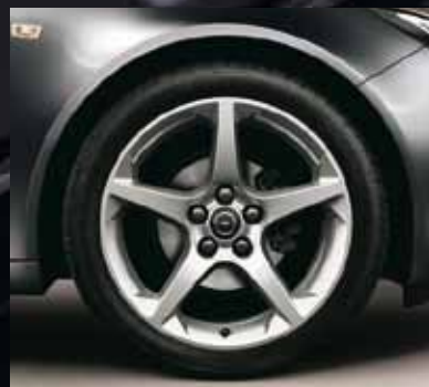
6 Легкосплавные колесные диски, 8.5 J x 19, 5-спиц, шины 245/40 R 19 (Q93).