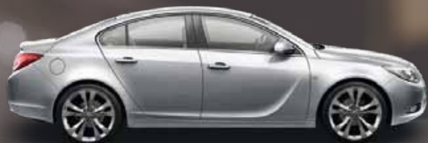
Sovereign Silver (Серебристый)