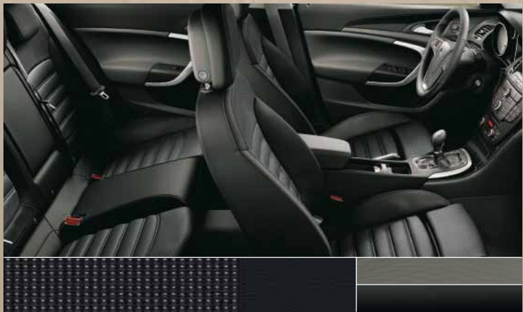
Отделка Vitesse/Atlantis, цвет – черный Декоративные молдинги: Rapid Cool, Piano Black