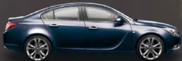
Royal Blue (Синий)