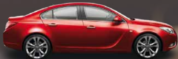
Power Red (Красный)