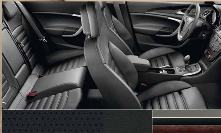
Перфорированная кожа Siena, цвет – черный Декоративные молдинги: Rapid Cool, Piano Black, Kibo Wood