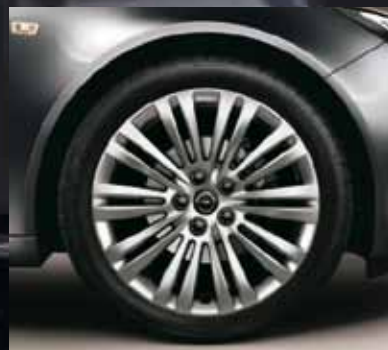
5 Легкосплавные колесные диски, 8 J x 18, 10-двойных спиц, шины 245/45 R 18 (RT4).