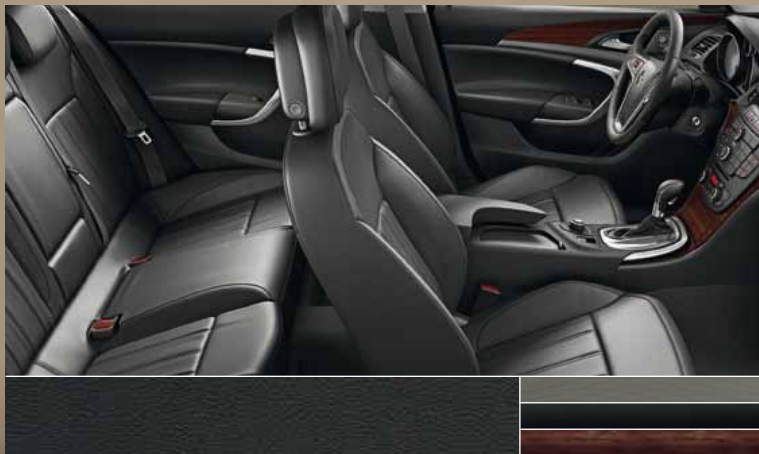
Кожа Siena, цвет – черный Декоративные молдинги: Rapid Cool, Piano Black, Kibo Wood