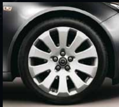
7 Легкосплавные колесные диски, 8.5 J x 19, 10-спиц, шины 245/40 R 19 (Q9S). Колесные диски с зеркальной полировкой.